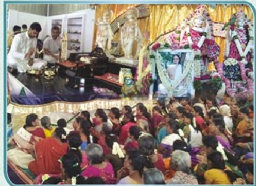
ஜூலை 10 - சிவசுந்தர் புதிய நகரம் நிகழ்ச்சி