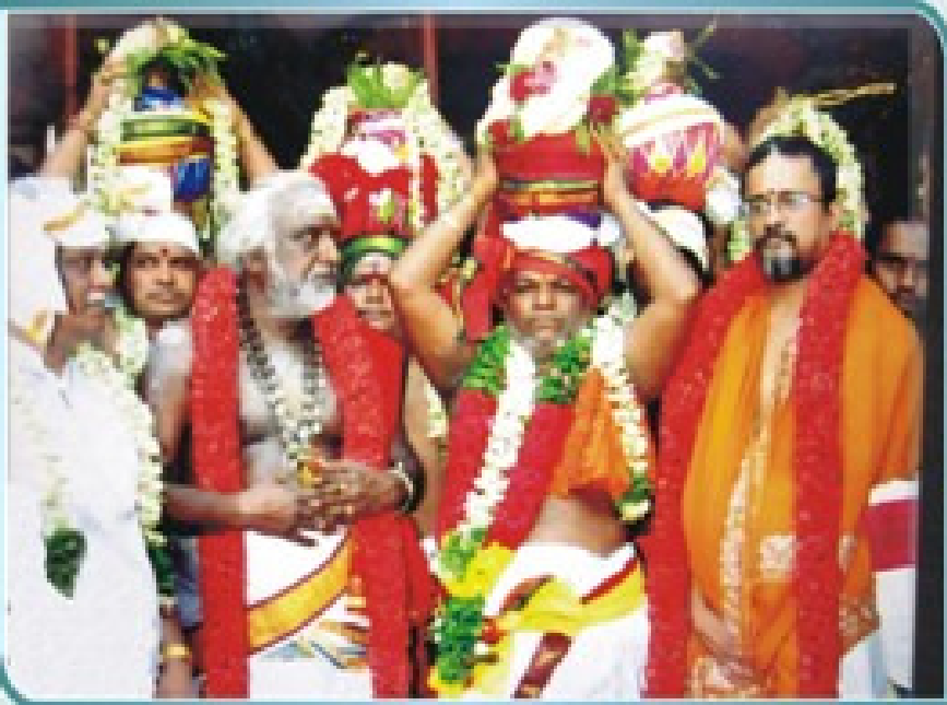
മേ 23 - ശ്രീമഠവാസിമാർ മുൻനിരയിൽ പ്രവേശന പന്തളം കമ്മീഷൻ കമ്മീഷൻ ശ്രീപ്രവേശനം കമ്മീഷൻ മേലിൽ കൂർവ്വാനുമ്പേട്