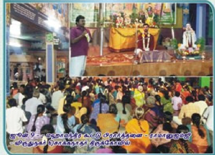
ஜூலை 9 - மதுராஹி உயர்நீதிமன்றம் - ராமானுஜம்ஜி - மதுராஹி மதுராஹி நிகழ்ச்சி